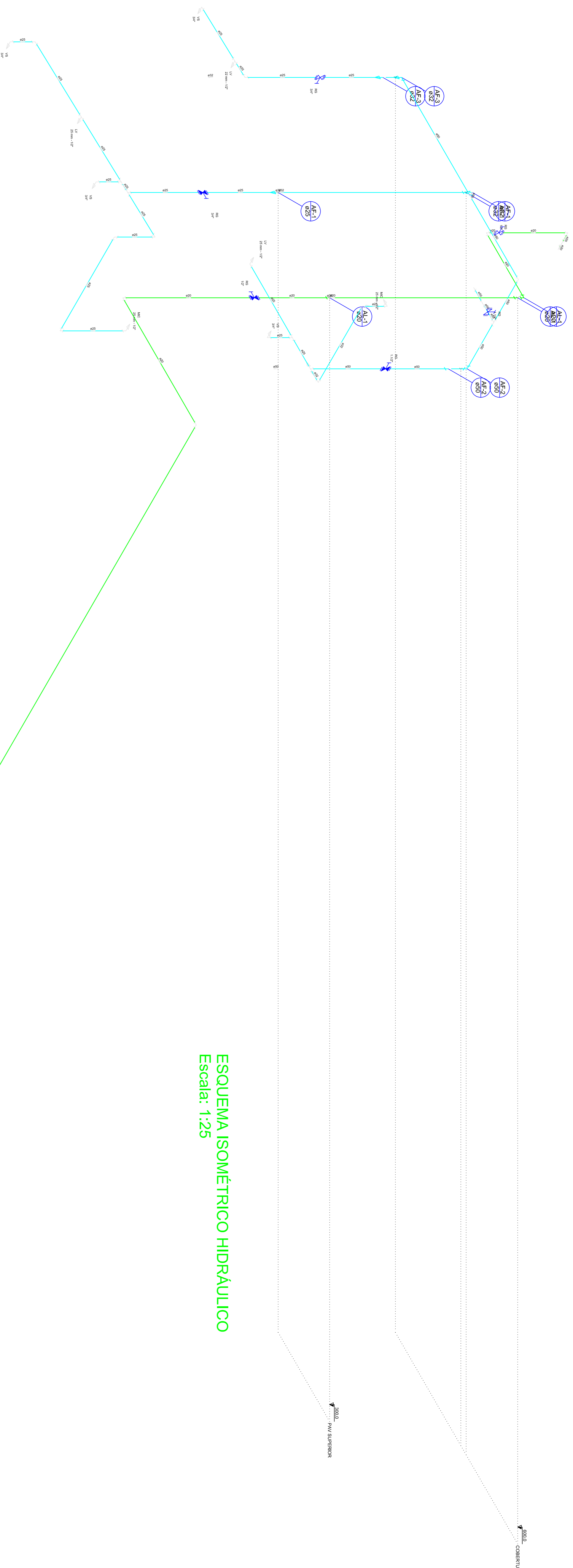
ESQUEMA ISOMÉTRICO HIDRÁULICO Escala: 1:25